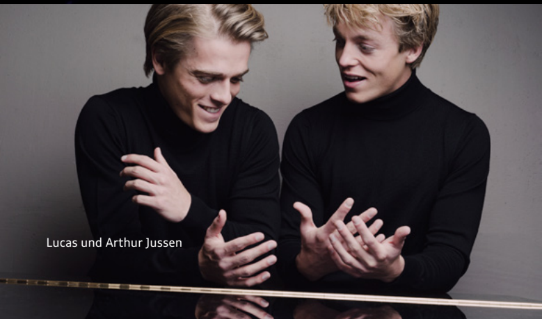
Lucas und Arthur Jussen

Fr. 30.06.2023 20.30 Uhr, Klenzepark Freier Eintritt