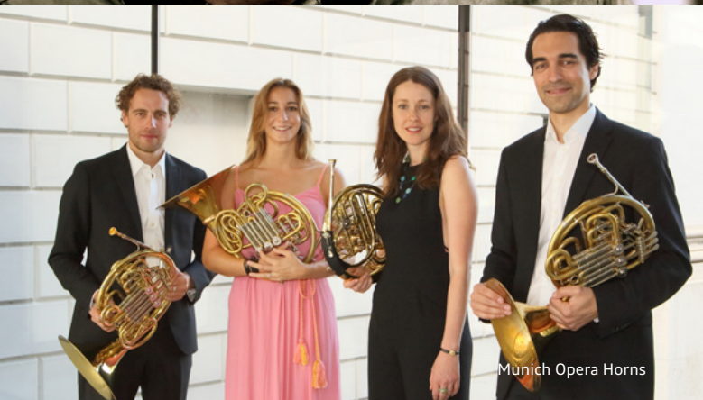
Munich Opera Horns