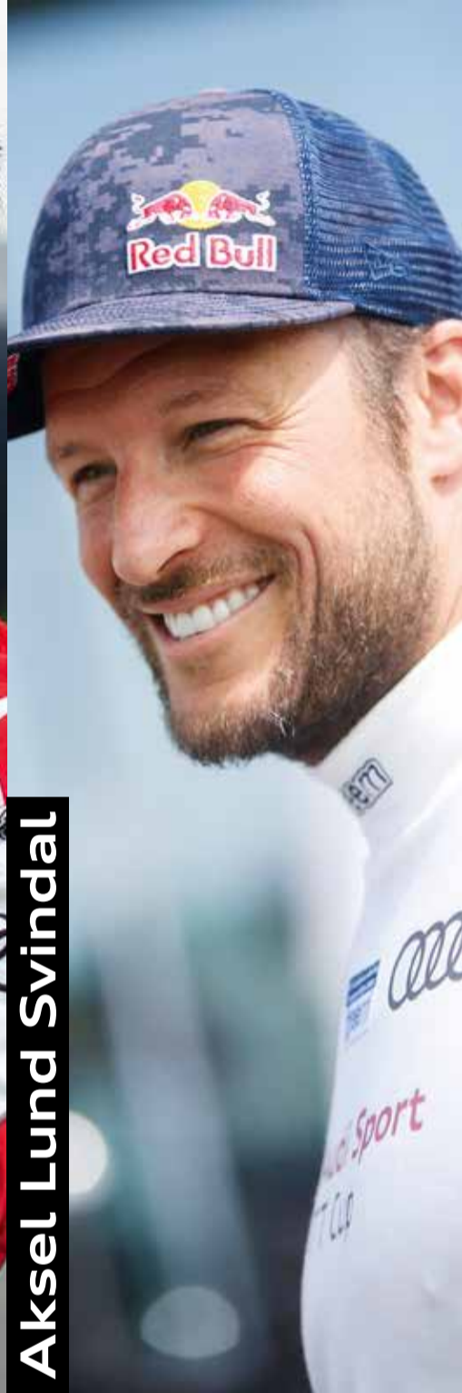
Aksel Lund Svindal