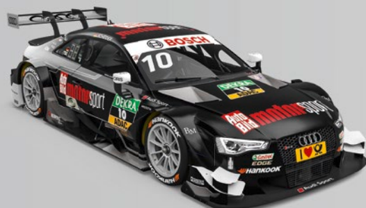
10 Timo Scheider (D) AUTO BILD MOTORSPORT Audi RS 5 DTM