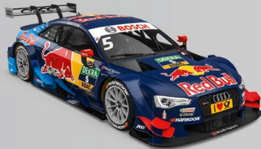
5 Mattias Ekström (S) Red Bull Audi RS 5 DTM