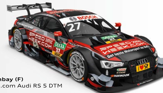
27 Adrien Tambay (F) Speedweek.com Audi RS 5 DTM