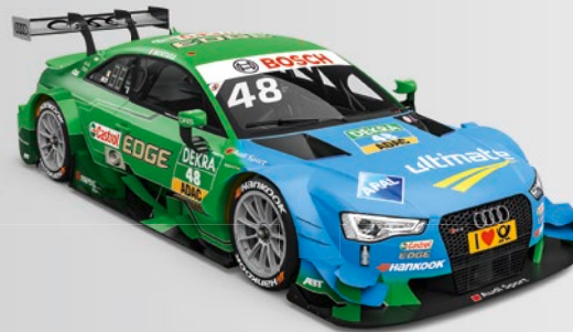
48 Edoardo Mortara (I) Castrol EDGE Audi RS 5 DTM