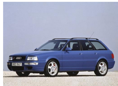
Audi Avant RS 2 (B4), Baujahr 1994

Im Audi Avant RS 2 (B4) tritt 1994 der bis dato stärkste Serien-Fünfzylinder, den Audi gebaut hat, in Aktion. Mit Turboaufladung, Einspritzung und serienmäßiger Abgasreinigung leistet er aus 2.226 cm 3 Hubraum, 232 kW (315 PS) bei 6.500 Umdrehungen pro Minute und verfügt über ein Drehmoment von 410 Newtonmeter bei 3.000 Touren.