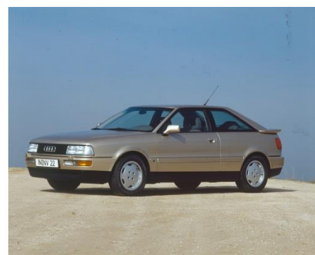
Audi Coupé 2.3E (B3), Baujahr 1989

1984 folgt eine komplette Neuentwicklung: Als erster Hersteller optimiert Audi den Fünfzylinder mit einer vollelektronischen Zündanlage samt Kennfeldsteuerung und einem serienmäßigen Katalysator. Aus 2.309 cm 3 schöpft er 100 kW (136 PS) bei 5.600 Touren und 188 Newtonmeter Drehmoment bei 3.500 Umdrehungen pro Minute. Der am meisten verbreitete Fünfzylinder von Audi kommt im Audi 100 2.3E (C3), im Audi Coupé 2.3E (B3) und im Audi 90 2.3 E (B3) zum Einsatz. Ab 1990 treibt er auch den Audi 100 2.3E (C4) sowie ein Jahr später den Audi 80 2.3E (B4) und das Audi Cabriolet 2.3E an. Hier leistet er 98 kW (133 PS) bei 5.600 Umdrehungen pro Minute und 186 Newtonmeter bei 4.000 Touren.