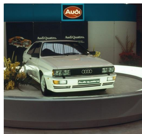
Audi quattro (B2), Baujahr 1980 (Automobilsalon Genf)

Auf dem Automobilsalon in Genf enthüllt Audi 1980 den Audi quattro (B2), ab Mitte der 1990er Jahre als Urquattro bezeichnet. Er setzt auf das Triebwerk vom Audi 200 5T (C2), jedoch mit Ladeluftkühlung. Dadurch erreicht das Turbo-Aggregat eine höhere Leistung von 147 kW (200 PS) bei 5.500 Umdrehungen pro Minute und 285 Newtonmeter Drehmoment bei 3.500 Touren. Die Karosserie des Audi quattro basiert auf dem Audi Coupé (B2), das wiederum vom Audi 80 abgeleitet ist. Verbreiterte Kotflügel, voluminösere Stoßfänger und Schweller sowie ein größerer Heckspoiler unterscheiden den Audi quattro vom Coupé.