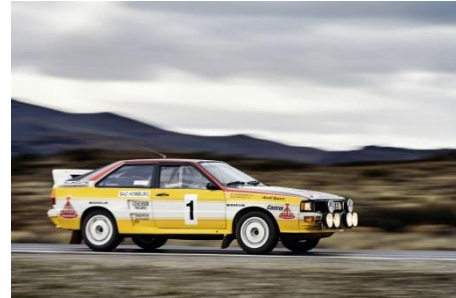
Audi quattro A2, Gruppe B, Baujahr 1983

Bei der Rallye Korsika 1983 startet Audi erstmals mit dem Audi quattro A2, Gruppe B. Sein 2,1-Liter-Reihen-Fünfzylinder mit Turboaufladung leistet 265 kW (360 PS) bei 6.500 Umdrehungen pro Minute und entwickelt 450 Newtonmeter Drehmoment bei 4.000 Touren. Zum Ende der Saison gewinnt der Finne Hannu Mikkola mit diesem Auto den Fahrertitel. Ein Jahr später setzt der Schwede Stig Blomqvist den Erfolg fort: Er wird Fahrerweltmeister und Audi zum zweiten Mal nach 1982 Marken-Rallye-Weltmeister.