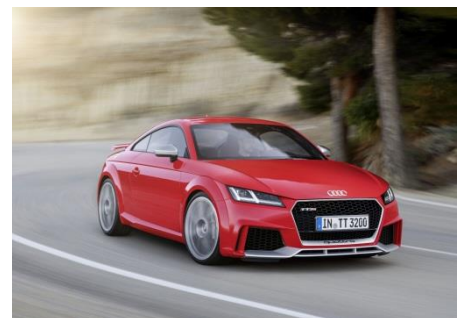
Audi TT RS Coupé, Baujahr 2016

Auf der Beijing Motor Show 2016 präsentiert Audi das neue TT RS Coupé* und den neuen TT RS Roadster*. Der Fünfcylinder ist in allen Bereichen weiterentwickelt – mit Leichtbaumaßnahmen, reduzierter innerer Reibung, gesteigerter Kraftentfaltung. Aus unverändert 2.480 cm 3 Hubraum holt das Turbo-Aggregat gut 17 Prozent mehr Leistung. Mit 294 kW (400 PS) ist es stärker als je zuvor. Das maximale Drehmoment von 480 Newtonmeter steht von 1.700 bis 5.850 Umdrehungen pro Minute bereit. Es sorgt für überragenden Durchzug, den der unverkennbare Fünfcylinder-Sound begleitet.