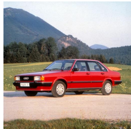
Audi 80 CD (B2), Baujahr 1982

Im April 1978 löst die Fünfzylinder-Vergaser-Version mit 85 kW (115 PS) den Zweiliter-Vierzylinder-Basismotor des Audi 100 (C2) ab. Das neue 1,9-Liter-Aggregat fördert die maximale Leistung bei 5.400 Umdrehungen zutage und stemmt 154 Newtonmeter Drehmoment bei 3.700 Touren auf die Kurbelwelle. Der Motor kommt im Audi 100 5 (C2), im Audi 80 CD (B2), im Audi Coupé GT 5S (B2) sowie im Audi 100 (C3) zum Einsatz.