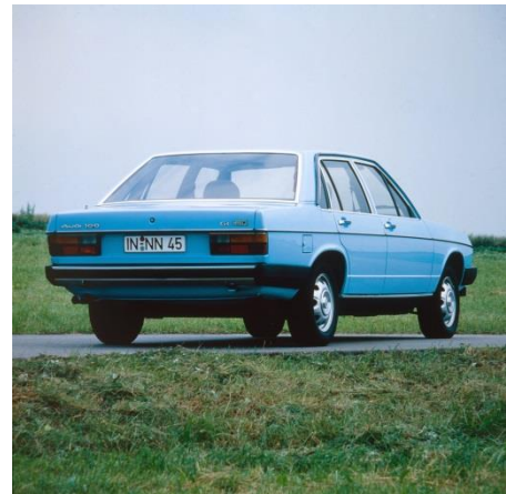
Audi 100 GL 5D (C2), Baujahr 1978

Mit dem Audi 100 (C2) präsentiert Audi 1978 sein erstes Dieselmodell. Der Fünfzylinder-Saugmotor mit zwei Liter Hubraum leistet 51 kW (70 PS) und 123 Newtonmeter Drehmoment. Er treibt auch die nachfolgende Generation C3 an, befeuert sowohl die Limousinen als auch die Avant-Versionen. Ab 1984 gibt es den Motor mit Turboaufladung und 64 kW (87 PS) Leistung sowie 172 Newtonmeter Drehmoment.