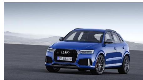
Audi RS Q3 performance, Baujahr 2016