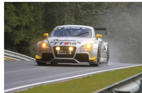
Audi TT RS Rennwagen, Baujahr 2011

Im Jahr 2010 startet Audi mit dem TT RS im Motorsport. Der für die Langstrecke entwickelte Rennwagen wird vom Fünfzylindermotor aus dem Serienmodell angetrieben. Durch Optimierungen an der Ladeluftkühlung und der Abgasanlage leistet das Aggregat 280 kW (380 PS) bei 5.800 Umdrehungen pro Minute. Das maximale Drehmoment von 500 Newtonmeter entfaltet sich bei 2.500 Touren. Der frontangetriebene Rennwagen gewinnt in der VLN-Langstreckenmeisterschaft 2010 und 2011 mehrere Siege in der Klasse SP4T bis 2,5 Liter Hubraum. Im August 2011 fährt er beim 6h-Rennen am Nürburgring den Gesamtsieg ein. Auch beim 24h-Rennen in der Eifel bringt Audi den TT RS im Jahr 2011 erfolgreich an den Start und erringt ebenfalls den Klassensieg.