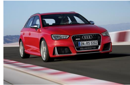
Audi RS 3 Sportback, Baujahr 2015

Im Sommer 2015 folgt der RS 3 Sportback* der zweiten Generation – das stärkste Auto im Premium-Kompaktsegment mit 270 kW (367 PS). Das Zusammenspiel von Turboaufladung und Direkteinspritzung erlaubt eine hohe Verdichtung von 10:1 und einen entsprechend guten Wirkungsgrad. Der Reihen-Fünfcylinder stemmt maximal 465 Newtonmeter auf die Kurbelwelle. Das Drehmoment steht schon bei 1.625 Umdrehungen pro Minute bereit und bleibt bis 5.550 Touren konstant. Seit Frühjahr 2016 bringt Audi die Ausbaustufe des Aggregats auch im Audi RS Q3 performance* zum Einsatz.