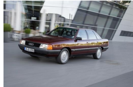
Audi 100 TDI (C3), Baujahr 1990

Einen weiteren Meilenstein der Automobilgeschichte präsentiert Audi 1989 auf der Internationalen Automobilausstellung in Frankfurt am Main: den Audi 100 TDI. Der erste Fünfzylinder-Turbodiesel mit Direkteinspritzung für einen Serien-Pkw schöpft aus 2,5 Liter Hubraum 88 kW (120 PS) und schickt 265 Newtonmeter Drehmoment an die Kurbelwelle. Er kommt im C3 und im C4 zum Einsatz, ab 1994 mit 103 kW (140 PS) und bereits 290 Newtonmeter Drehmoment.