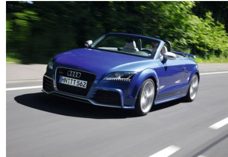
Audi TT RS Roadster, Baujahr 2009

Im TT RS plus ab 2012 leistet der Motor 265 kW (360 PS) bei 6.700 Umdrehungen pro Minute und entfaltet 465 Newtonmeter Drehmoment bei 5.400 Touren.