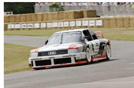
Audi 90 quattro IMSA GTO, Baujahr 1989

Bei der IMSA GTO in den USA bestreitet 1989 der Audi 90 quattro mit dem leistungsstärksten Werks-Fünfzylinder seinen Renneinsatz. Der turboaufgeladene Aluminium-Motor ist ein speziell für den Rennsport konstruiertes 2,2-Liter Hochleistungsaggregat. Es leistet 530 kW (720 PS) bei 7.500 Umdrehungen pro Minute und entwickelt 720 Newtonmeter Drehmoment bei 6.000 Touren. Insgesamt gewinnt der Audi 90 quattro IMSA GTO in der Saison 1989 sieben Rennen der amerikanischen Tourenwagenserie.