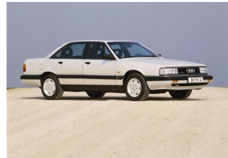
Audi 200 quattro 20V (C3), Baujahr 1990

Mit zwei Katalysatoren, Vierventiltechnik, geschlossenem Tankentlüftungssystem und Diagnosesystem ist dieses Aggregat auf einem sehr hohen Stand der Abgasreinigung und -technik. Zunächst im Audi 200 quattro 20V (C3) lieferbar, folgt ein Jahr später der Audi quattro 20V (B2) und 1990 das Audi S2 Coupé (B3). Der Fünfzylinder-Turbo verfügt über 2.226 cm 3 Hubraum, 162 kW (220 PS) bei 5.700 Umdrehungen pro Minute und 309 Newtonmeter Drehmoment bei 1.950 Touren.