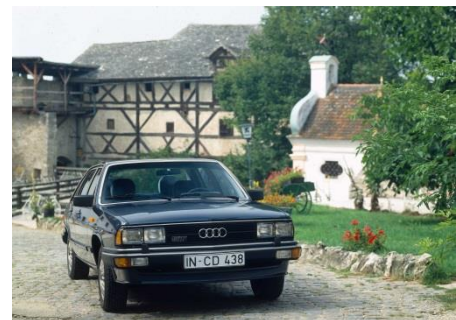
Audi 200 5T (C2), Baujahr 1981

1980 kommt der Audi 200 5T (C2) auf den Markt, in dem der erste aufgeladene Benzinmotor der Marke mit den Vier Ringen für Vortrieb sorgt. Aus 2.144 cm 3 Hubraum schöpft der Fünfzylinder 125 kW (170 PS) bei 5.300 Umdrehungen pro Minute und 265 Newtonmeter Drehmoment bei 3.300 Touren. Der Audi 200 5T (C2) ist der erste Audi in der Luxusklasse und hat serienmäßig die noble Ausstattung des Audi 100 CD an Bord.