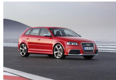
Audi RS 3 Sportback, Baujahr 2011