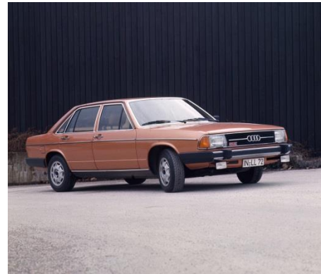
Audi 100 GLS 5E (C2), Baujahr 1979

Im August 1976 stellt Audi in Luxemburg den Audi 100 der zweiten Generation (C2) vor. Erstmals sorgt ein Fünfzylinder-Benzinmotor in einem Modell der Marke mit den Vier Ringen für Vortrieb. Der Einspritzmotor mit 2.144 cm 3 Hubraum leistet 110 kW (136 PS) bei 5.700 Umdrehungen pro Minute. Das maximale Drehmoment von 185 Newtonmetern liegt bei 4.200 Touren an. Die Markteinführung des Audi 100 (C2) folgt im März 1977. Ab September 1979 ist der Fünfzylinder-Motor auch im Audi 200 lieferbar, ab August 1982 ist er im Nachfolger des C2 verbaut, dem Audi 100 C3.