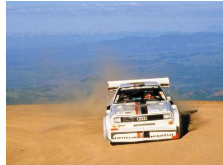
Audi Sport quattro S1 (E2), Baujahr 1987

1987 gewinnt Walter Röhrl mit dem Audi Sport quattro S1 (E2) das legendäre Bergrennen am Pikes Peak (USA) und stellt dabei einen neuen Rekord auf. In 10 Minuten und 47,85 Sekunden bewältigt er die knapp 20 Kilometer lange Strecke mit 156 Kurven und einem Höhenunterschied von 1.439 Metern. Der 2,1-Liter-Fünfzylinder im Audi Sport quattro S1 (E2) leistet 440 kW (598 PS) bei 8.000 Umdrehungen pro Minute und fördert 590 Newtonmeter Drehmoment bei 5.500 Touren zutage.