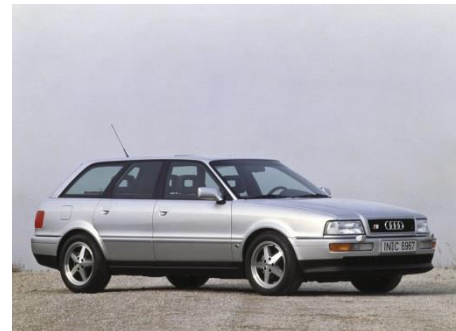
Audi S2 Avant (B4), Baujahr 1992

In der Sportversion des Audi 100 (C4), dem Audi S4 von 1991, arbeitet ein aufgeladener 2,2-Liter-Reihen-Fünfzylinder mit 20 Ventilen. Er leistet 169 kW (230 PS) bei 5.900 Touren. Das Drehmoment erreicht dank kurzzeitiger Erhöhung des Ladedrucks einen Spitzenwert von 350 Newtonmetern bei 1.950 Umdrehungen pro Minute. Das Aggregat sorgt auch im Audi S2 Avant (B4) und im Audi S2 Coupé (B3) für Vortrieb. Ab 1994 trägt der Audi S4 den Namen Audi S6.